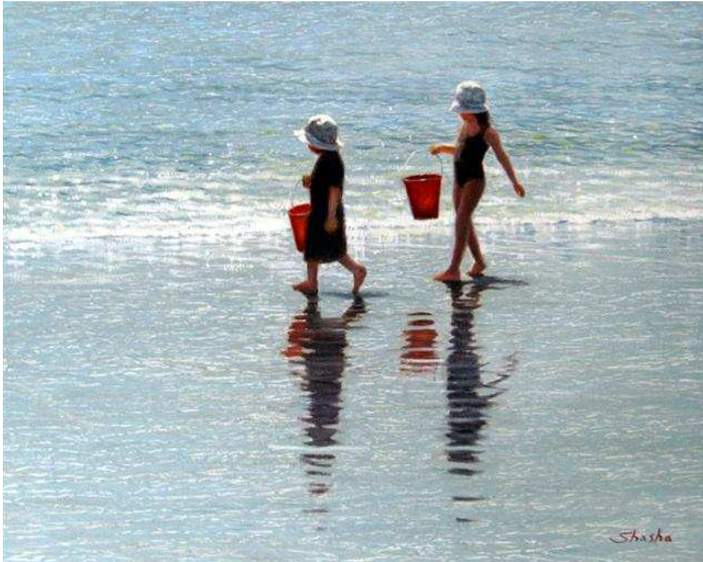
Pour nos lecteurs, un tableau, avant-goût des vacances

Merci à nos 10986 membres pour Israël et la Tradition