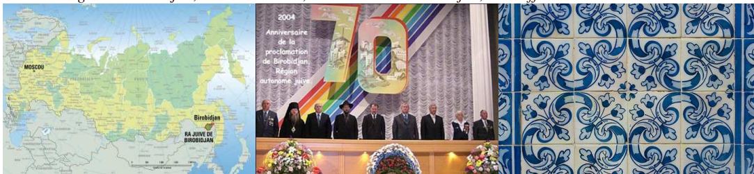
Cérémonie pour le 70e anniversaire du Birobidjan juif

R. Weinberg : Le Birobidjan, Ed. Autrement ; P. Braun : Le Birobidjan, Ed Laffont.