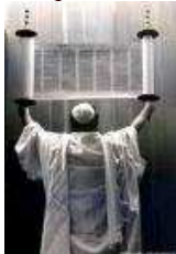
Le rôle de D. dans la Techouva

Question : la complexité de la Techouva entraîne la crainte de violer les obligations qui en découlent. Un caractère obsessionnel peut y trouver matière à déplacer sa pathologie d'un champ à l'autre. Le repentant parvient-il à une résistance par rapport à ses tendances antérieures ou se limite-t-il à des organisations qui lui évitent de tomber dans la délinquance, mais au prix d'un déséquilibre intérieur plus grand que son état antérieur ?