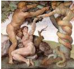
Mal et péché de l'homme