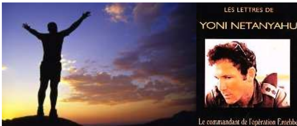
Yoni Netanyahou frère de Bibi, assassiné lors du Raid de libération des otages d'Entebbe Extrait d'une de ses lettres écrite à 17 ans avec une incroyable maturité

"Je ne veux pas arriver à un certain âge, regarder autour de moi et découvrir que je n'ai rien construit. Je ne veux pas ressembler à certains qui comme des insectes, ne font jamais rien, pris par la routine de leur vie. Conscient que ce n'est pas lors de ma mort que je devrais rendre compte de ma vie, je dois pouvoir me dire : 'j'ai fait ceci et aussi cela'. La mort est la seule chose qui me dérange, qui m'intrigue sans me faire peur : une vie sans idéal n'a pas beaucoup de valeur. Si je dois sacrifier ma vie pour réaliser mon idéal je le ferai avec joie."