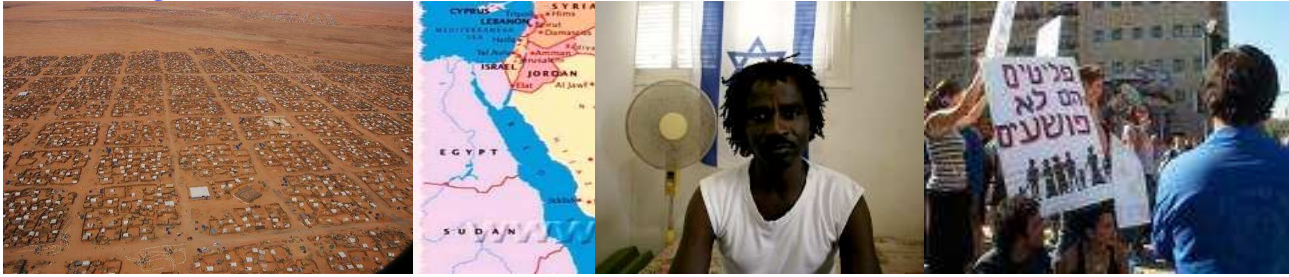
Darfour - Désespoir : camps de réfugiés à perte de vue - Manifestation israélienne proréugiés du Darfour : "des réfugiés pas des criminels"

On parle avec raison des victimes palestiniennes et israéliennes des conflits locaux, mais cela, de manière absolument disproportionnée avec d'autres conflits tels, par exemple, celui du Darfour. Dans ce massacre d'une toute autre échelle et dont on parle pourtant très peu, nul ne prête un rôle quelconque à Israël. Et pourtant, ce minuscule pays a accordé la nationalité israélienne à près de 1000 réfugiés africains noirs sans rapport avec ses objectifs propres, soit l'équivalent en proportion de 10.000 pour la France ou 50.000 pour les USA qui en sont bien loin. Et malgré les risques d'infiltration malfaisants en provenance du Soudan, pays ennemi déclaré d'Israël... Tout cela, à cause du racisme anti-noir de bien des musulmans voisins et grâce à sa générosité spontanée.