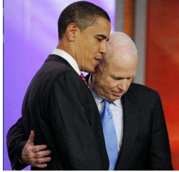
Revue des positions d'Obama et de Mac Cain sur la situation au Moyen Orient