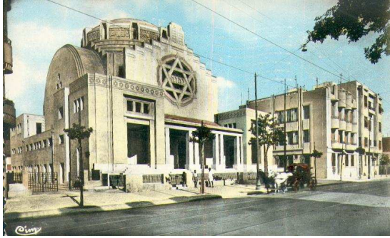
Grande Synagogue de Tunis. Second bâtiment à droite, Immeuble Félix Perez à l'ex 104 Avenue de Paris (Avenue de la Paix)