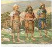
Noé a trois fils : Chem, 'Ham et Yefet (le Nom, le Chaud et le Beau).

1) Chem-Le Nom d'où provient le mot Sémite attache de l'importance au Nom de D. ieu.