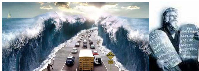
Photo1 Veronique Cahen